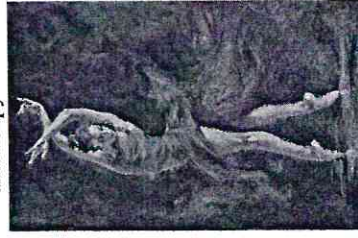
1. Таблица к заданию